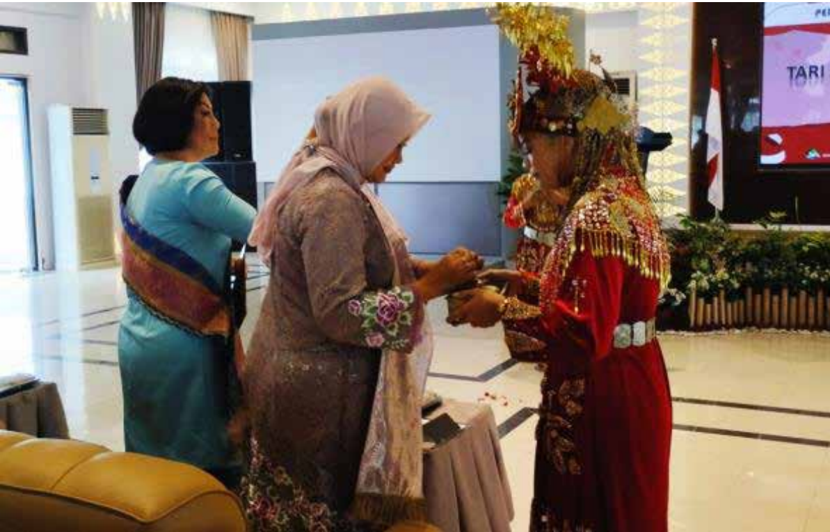
TARIAN Sekapur Sirih pembuka kegiatan Peringatan Hari Ibu di Gedung Mahligai, Provinsi Kepulauan Bangka Belitung

“Perempuan ikut mencipta, membentuk sejarah, dan peradaban manusia ke arah yang lebih bertata nilai, berkeadilan, humanis dalam tatanan politik, ekonomi, sosial, budaya bahkan teologi,”